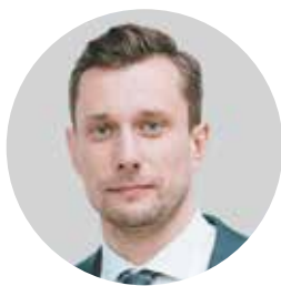
Alexey Kalachev, CEO of the Russian Convention Bureau

You are holding the second issue of special Russian Convention Bureau magazine – Open to the world. It is dedicated to the events of international associations that contribute to economic and industry-specific development of the countries. For over 100 years people gather in communities according to the professional interests. International associations organize congresses and forums in different countries. According to ICCA (International Congress and Convention Association), more than 24 thousand events of the international associations are hold annually worldwide with participation of over 4.8 mln delegates.