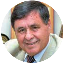
Arnold Butov, President of the Russian National Union of Beekeepers

The General Assembly of Apimondia, the International Federation of Beekeepers' Associations, which took place in 2017 in Istanbul, selected the host city for the 47th Congress of the Association. The event will be held in Ufa, the capital of the Republic of Bashkortostan