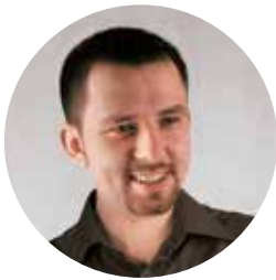
Alexander Veraksa, Director, Russian Psychological Association

The European Psychological Congress will open in Moscow in 2019. According to its organizers, approximately one half of all the delegates will be foreign specialists, and their expenses will generate more than RUB 385 mln in income to the capital of Russia